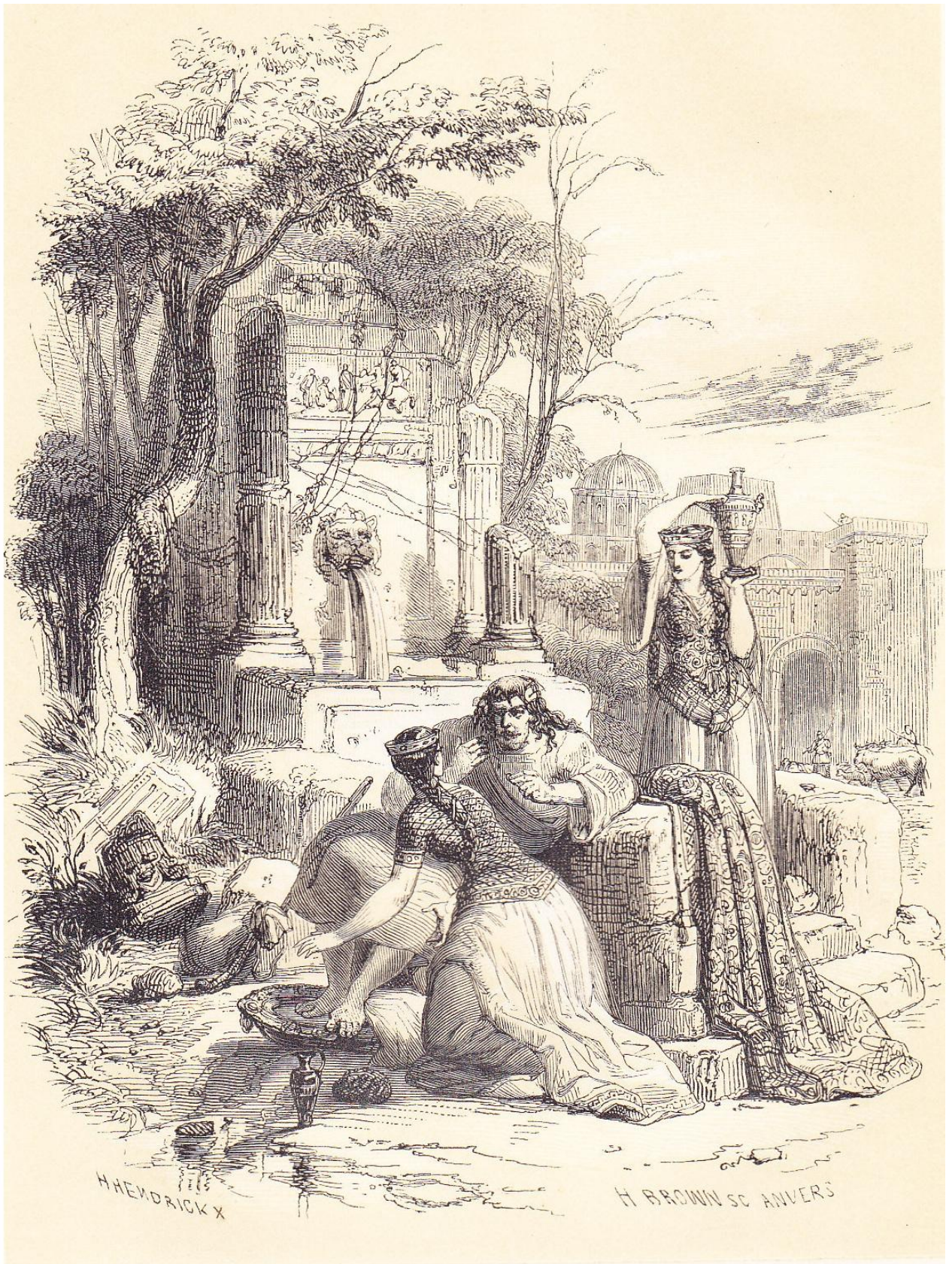
Le Gaulois Aurélien, déguisé en mendiant, offrant à Clotilde l'anneau de son maître.